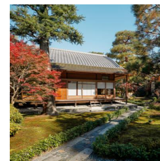
▲お食事会場からはお庭がご覧いただけます。